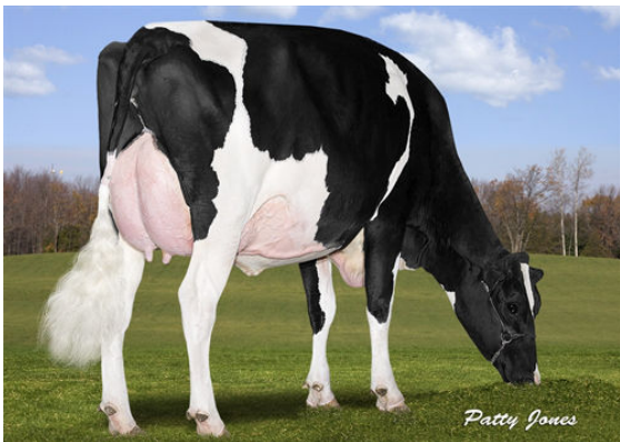
ALMERSON CONTROL CHAMPAGNE