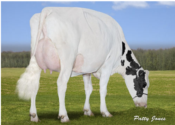
VELTHUIS B CONTROL LEGACY