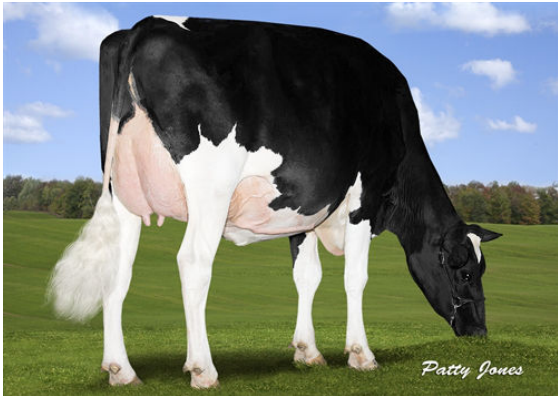
ORSERDALE CONTROL DELAWARE